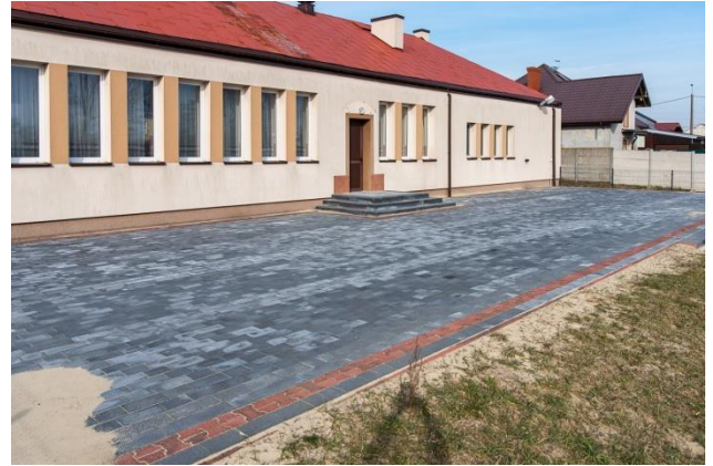
Kostka przy strażnicy OSP Stary Pilczyn