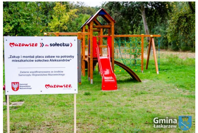
Plac zabaw w Aleksandrowie

Serdecznie dziękujemy wszystkim Państwu Sołtysom zaangażowanym w realizację tych zadań, Państwu Radnym oraz wszystkim mieszkańcom, którzy uczestniczyli w pracach społecznych. To dzięki tej Państwa pracy, Waszym pomysłom, staraniom i zaangażowaniu mieszkańcy Waszych sołectw mogą cieszyć się z kolejnych udanych inwestycji przy budynkach i w miejscach użyteczności publicznej.