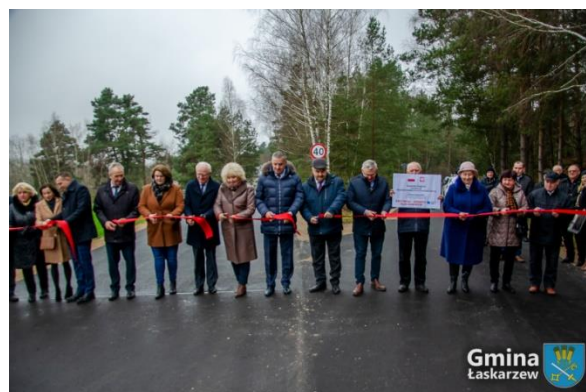
Odbiór drogi gminnej Krzywda-Izdebno-Aleksandrów