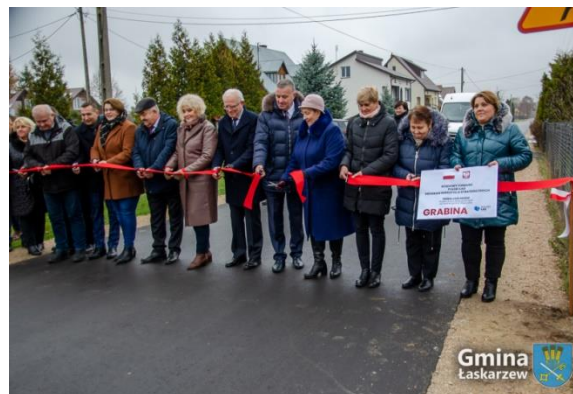
Odbiór drogi gminnej w Grabinie