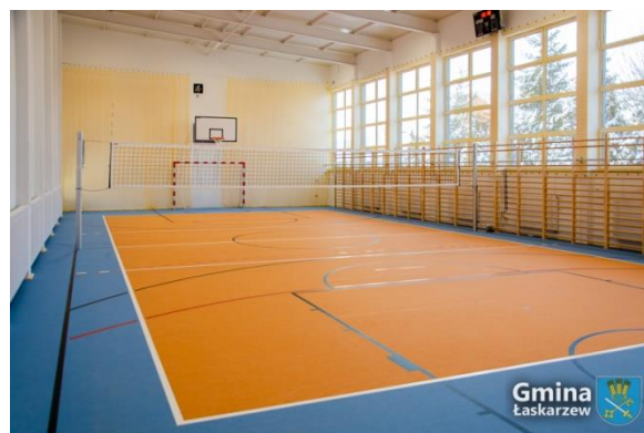
Hala sportowa przy ZS w Izdebnie

W roku 2022 zostały przeprowadzone również dwa znaczące zadania mające na celu wygenerowanie oszczędności przy oświetleniu obiektów sportowych na terenie gminy. Jest to szczególnie ważne w dobie kryzysu energetycznego i znaczącego wzrostu cen energii elektrycznej.