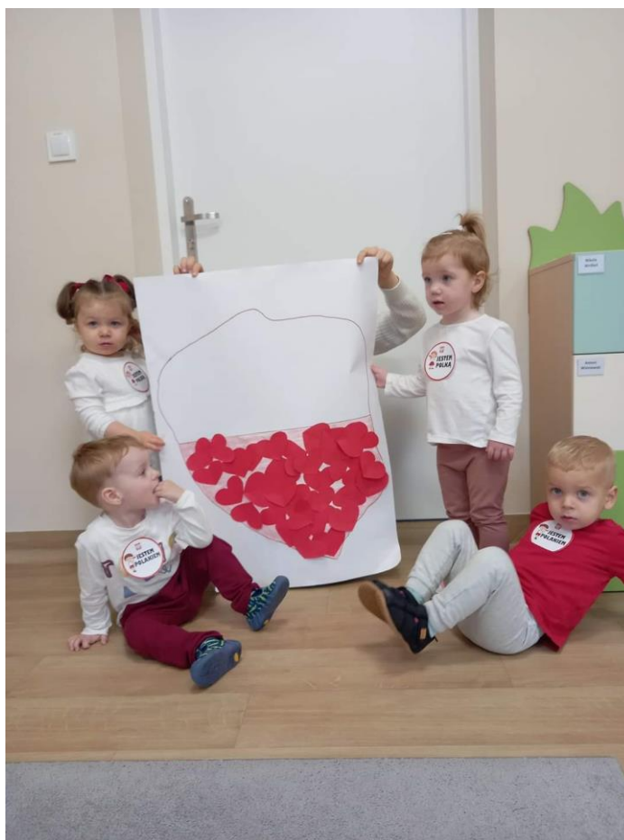
Święto Niepodległości w starszej grupie „Biedronek”

którego podejmują różne działania a dzieci mają okazję do kreatywnego spędzania czasu w gronie rówieśników. Podczas zajęć prowadzonych przez opiekunki dzieci m. in. ćwiczyły koordynację wzrokowo-ruchową i narządy mowy, tańczyły i grały na instrumentach muzycznych, budowały z klocków, świętowały urodziny, tworzyły kąciki przyrodnicze, w ogrodzie założyły własny warzywniak, zapoznały się z zasadami ruchu drogowego, ćwiczyły przechodzenie przez pasy drogowe przy pomocy świateł, czytały i wysłuchiwały książki, poznały symbole narodowe i obchodziły uroczystości patriotyczne, świętowały m.in. Dzień Babci i Dzień Dziadka, Walentynki, Dzień Kobiet, Dzień Chłopaka, Dzień Mamy i Dzień Taty, obchodziły Święto Dyni oraz Dzień Postaci z Bajek, Dzień Pluszowego Misia, Dzień Kredki, Andrzejkę i Mikołajki.