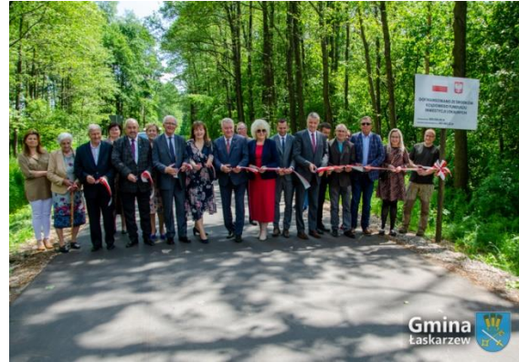
Otwarcie drogi do Leokadii