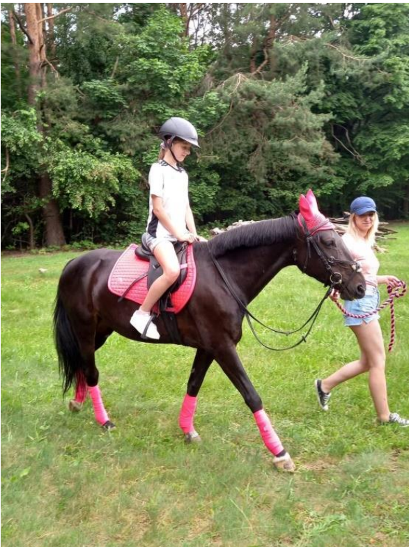
Przejażdżki konne na Pikniku Rodzinnym w GKD „Promyczek”

W czerwcu 2022 r. w Gminnym Klubie Dziecięcym „Promyczek” odbył się Piknik Rodzinny, który uświetniony został przejażdżkami konne, dmuchaną zjeżdżalnią, popcorn, watę cukrową, pokaz sokolnika, zabawy z chustą animacyjną, pokaz baniek mydlanych, brokatowe tatuaże, mnóstwo pysznego jedzenia oraz wiele innych atrakcji.