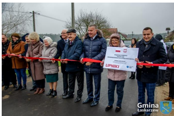
Odbiór drogi gminnej w Lipnikach