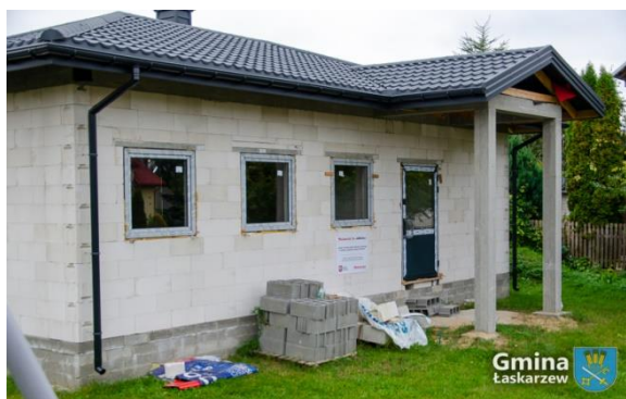
Świetlica wiejska w Nowym Pilczynie

W ramach zadania wykonano zakup i montaż stolarki okiennej i drzwiowej w świetlicy wiejskiej w Nowym Pilczynie w następującym zakresie: okna – 8 kpl, drzwi zewnętrzne – 2 kpl, drzwi wewnętrzne – 6 kpl, parapety zewnętrzne – 8 szt., parapety wewnętrzne – 8 szt. Całkowity koszt zadania 28.654,00 zł. Dofinansowanie MIAS – 10.000 zł.