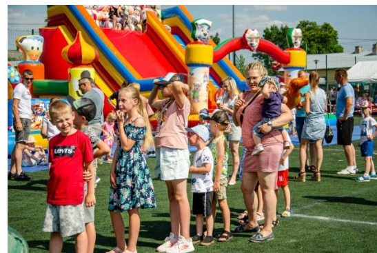
Gminny Dzień Rodziny