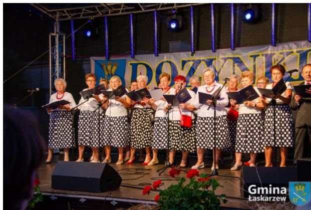
Uczestnicy Klubu Senior+ podczas występów na Dożynkach Gminno-Parafialnych w Krzywdzie