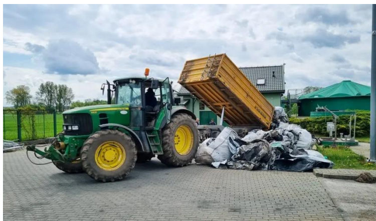
Zbiórka folii rolniczych na terenie PSZOK

Tak jak co roku również w roku 2022 Gmina zakończyła i rozliczyła realizację zadania pn.: „Usuwanie wyrobów zawierających azbest z terenu Gminy Łaskarzew w 2022 roku”. Zadanie dotyczyło 35 osób, które złożyły wnioski do tut. Urzędu. W ramach zadania dokonano unieszkodliwienia azbestu w ilości 102,941 Mg. Gmina Łaskarzew otrzymała na ten cel dotację w wysokości do 34.999,94,00 zł z Wojewódzkiego Funduszu Ochrony Środowiska i Gospodarki Wodnej w Warszawie, co stanowi 100% kosztu kwalifikowanego tego zadania.