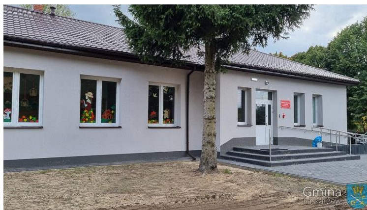
Gminny Klub Dziecięcy „PROMYCZEK” w Starym Helenowie

Na terenie Gminy Łaskarzew funkcjonuje jeden klub dziecięcy, który został utworzony z dniem 17.05.2021 r. Uchwałą nr XXIII/163/2021 z dnia 21.04.2021 r. jako Gminny Klub Dziecięcy „Promyczek” w Starym Helenowie. Swoją działalność rozpoczął od 1.09.2021 r. i prowadził ją nieprzerwanie przez cały 2022 rok. GKD „Promyczek” jest wpisany do Rejestru Żłobków.