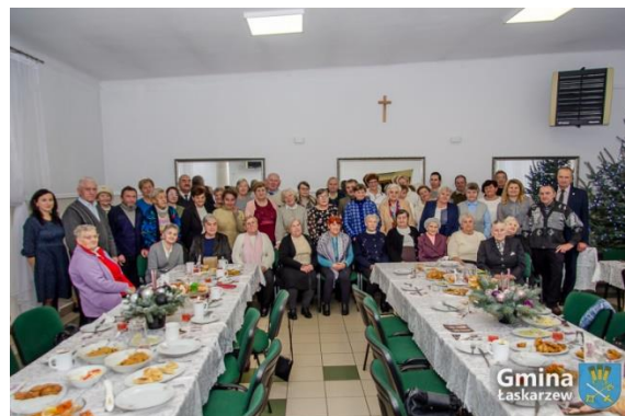
Spotkanie dla starszych i samotnych