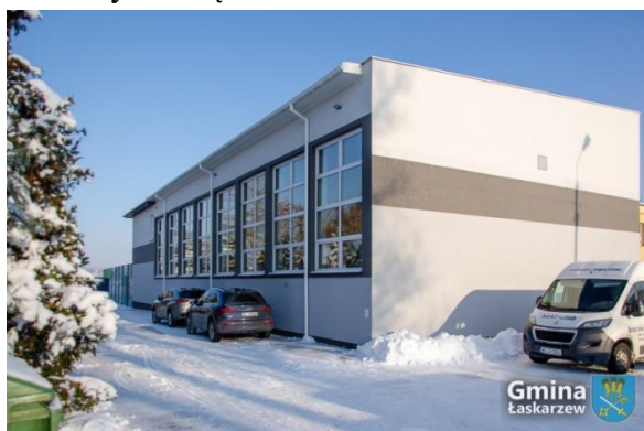
Hala sportowa przy ZS w Izdebnie

Uroczyste oddanie hali odbyło się 9 lutego 2023 r. i zostało połączone z uroczystością nadania sztandaru dla ZS w Izdebnie.