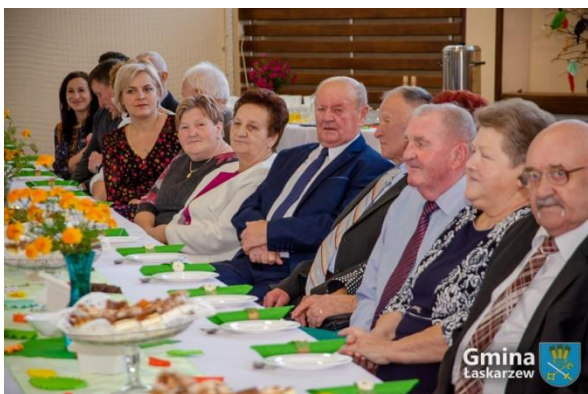
Złote i Diamentowe Gody w Starym Pilczynie