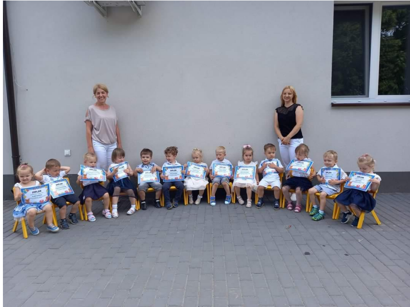
Pożegnanie dzieci odchodzących z GKD „Promyczek”

W czerwcu 2022 r. w Gminnym Klubie Dziecięcym „Promyczek” odbył się Piknik Rodzinny, który uświetniony został przejażdżkami konne, dmuchaną zjeżdżalnią, popcorn, watę cukrową, pokaz sokolnika, zabawy z chustą animacyjną, pokaz baniek mydlanych, brokatowe tatuaże, mnóstwo pysznego jedzenia oraz wiele innych atrakcji.