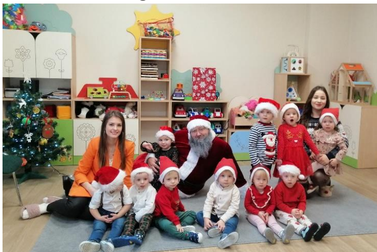
Mikołajki w Gminnym Klubie Dziecięcym „Promyczek”

W 2022 roku wydatki na bieżące utrzymanie GKD „Promyczek” wyniosły: 467 222,32 zł natomiast dochody z tyt. wpływów za uczęszczanie dzieci do GKD „Promyczek” w 2022 r. to ogółem: 188 254,56 zł.