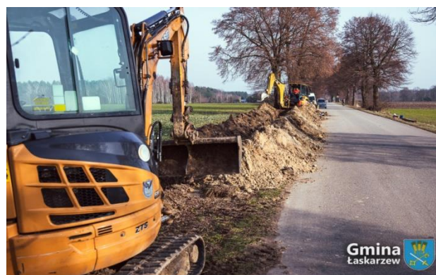
Roboty przy budowie sieci wodociągowej w Rowach

Gmina Łaskarzew posiada sieć kanalizacyjną o łącznej długości: 9,79 km znajdującą się w miejscowościach: Kacprówek, Stary Pilczyn, Nowy Pilczyn i Melanów. Na obszarze gminy z sieci kanalizacyjnej korzysta 272 gospodarstw domowych.