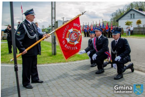
Uroczystość nadania sztandaru dla Ochotniczej Straży Pożarnej w Woli Rowskiej