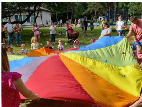
Wspólne zabawy na Pikniku Rodzinnym w GKD „Promyczek”