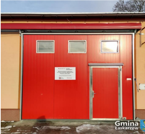
Remont garażu OSP Wola Łaskarzewska