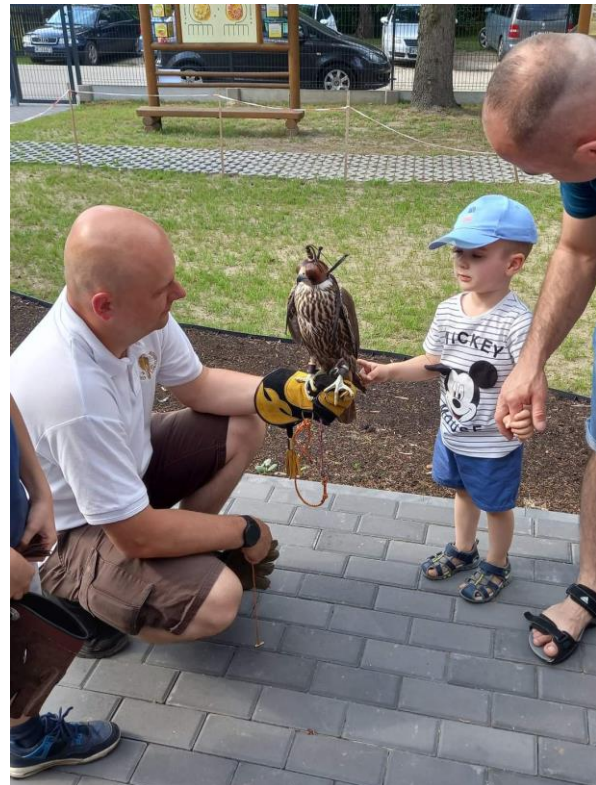
Pokaz sokolnika na Pikniku Rodzinnym w GKD „Promyczek”