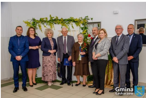
Złote i Diamentowe Gody w Dąbrowie