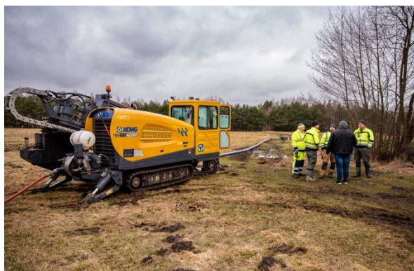
Roboty przy budowie sieci wodociągowej w kierunku Starego Helenowa