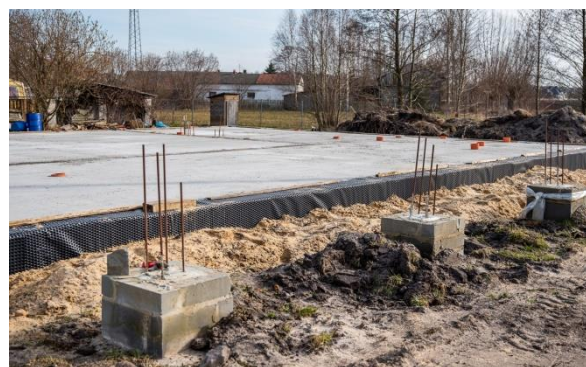
Fundamenty pod świetlicę wiejską w Budlu

W roku 2022 również w Budlu dzięki staraniom mieszkańców i środkom budżetowym w wysokości 12.413,16 zł udało się wykonać fundamenty pod planowaną świetlicę wiejską. Pozwoli to na realizację dalszego etapu budowy w latach następnych.