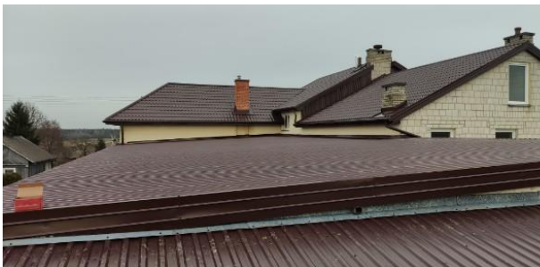
Dach na budynku OSP Izdebnio