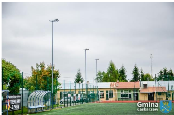
Nowe oświetlenie na boisku w Krzywdzie