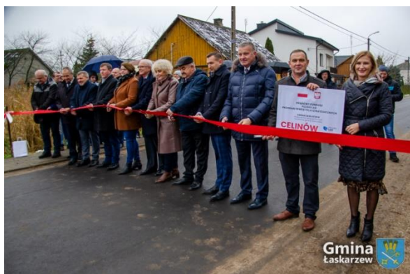
Odbiór drogi gminnej w Celinowie

Wszystkie przebudowy realizowane były przez firmę Fedro Sp. z o.o. z Osiecka.