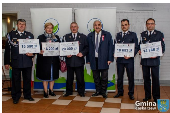
Przyznane promesy na realizację zadań w 2022 roku

Ponadto w roku sprawozdawczym Gmina udzieliła wsparcia dla OSP w Melanowie w formie dotacji w kwocie 1.500,00 zł na dofinansowanie zakupu sprzętu pożarniczego w ramach zadania „Zapewnienie gotowości bojowej jednostki ochrony przeciwpożarowej włączonej do KSR-G”.