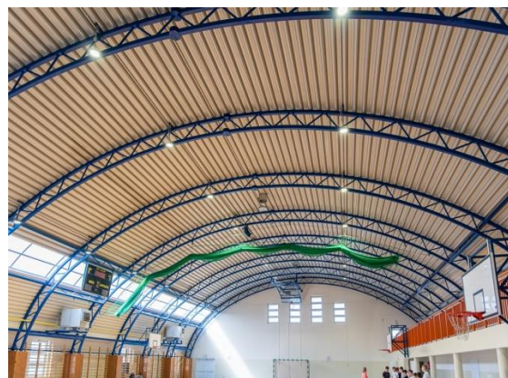
Lampy led w hali sportowej w Woli Łaskarzewskiej

2. Modernizacja oświetlenia w hali sportowej w Woli Łaskarzewskiej poprzez zakup i wymianę istniejących lamp rtęciowych na energooszczędne lampy BLAUPUNKT-HBJ100NW o mocy 100W – 24 szt. Całkowita wartość zadania 18.000,00 zł, w tym dofinansowanie z Wojewódzkiego Funduszu Ochrony Środowiska i Gospodarki Wodnej w Warszawie 16.200,00 zł.