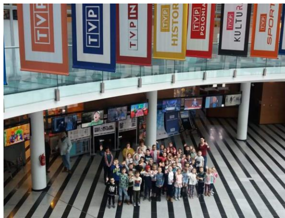
Wycieczka do Telewizji