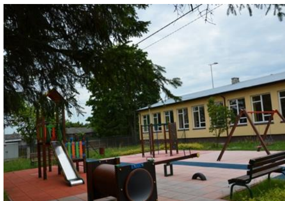
Szkoła Podstawowa w Krzywdzie