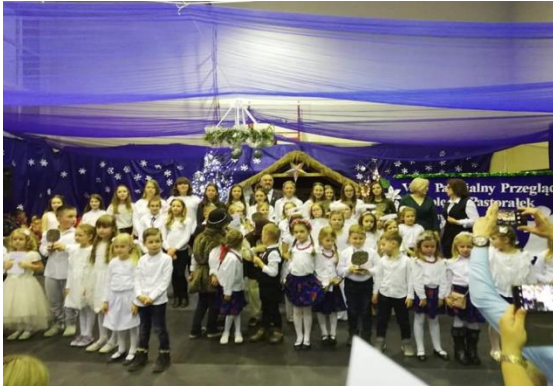
VIII Parafialno-Gminny Przegląd Kolęd i Pastoralek