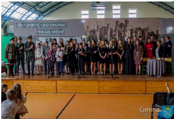
76. Rocznicą Pacyfikacji Wanat