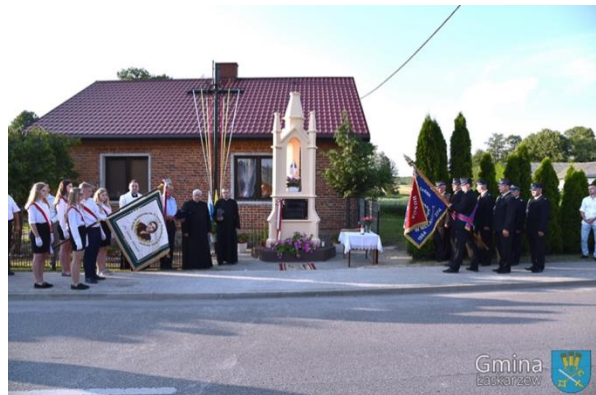
Uroczystości w Kacprówku