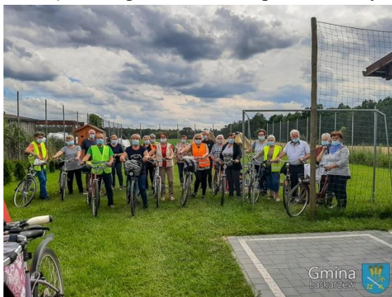
Seniorzy na wycieczce rowerowej

Niestety w 2020 roku nie udało się zrealizować wszystkich zaplanowanych działań w związku z ograniczeniami spowodowanymi wystąpieniem pandemii COVID-19.