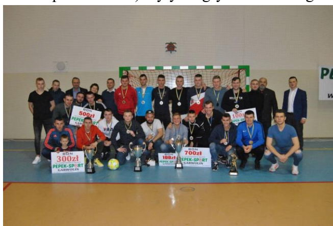
GLH Futsal Cup