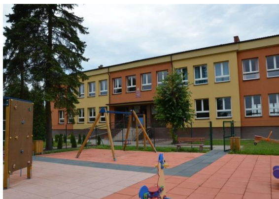
Zespół Szkół w Izdebnie