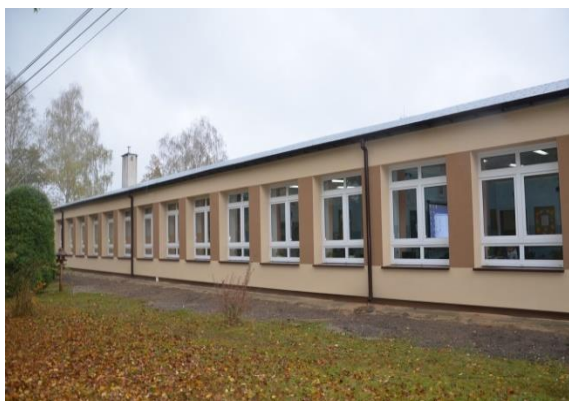
Szkoła Podstawowa w Dąbrowie z/s w Woli Łaskarzewskiej