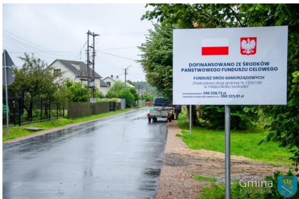
Droga gminna Nr 130610W w Leokadii po przebudowie

Powiat zakończył roboty przy remoncie drogi powiatowej Nr 1346W w Zygmuntach, gdzie w ramach zadania położono nową nakładkę bitumiczną na odcinku ok. 900 mb. Powiat Garwoliński zrealizował również remont drogi powiatowej Nr 1348W w Ksawerynowie, polegający na położeniu nowej 4-centymetrowej warstwy asfaltowej na dwóch odcinkach o łącznej długości 681 mb, oraz wykonaniu poboczy z kruszywa. Na realizację zadania Gmina Łaskarzew przeznaczyła środki w postaci dotacji w wysokości 100.000 zł, zaś całkowite koszty robót wynoszą blisko 160 tys. zł. Przeprowadzono również remont drogi powiatowej Nr 1327W Ruda Talubska – Kobyla Wola – do drogi Nr 17. W tym przypadku środki na realizację zadania pochodziły w 100% z budżetu Powiatu Garwolińskiego. Dzięki realizacji zadania powstał blisko 1,5 kilometrowy tzw. „łącznik”, dzięki któremu znacznie ułatwił się dojazd do węzła Górzno i drogi S17. Na podbudowie z kruszywa położone zostały dwie warstwy asfaltu (4 + 4cm), wykonane zostały pobocza z kruszywa łamanego, zjazdy i odwodnienie. Zadanie realizowała ZURB PAROL z Garwolina, a jego koszt to blisko 850 tys. zł.