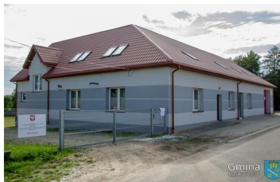
Budynek świetlicy wiejskiej w Uściercu po termomodernizacji