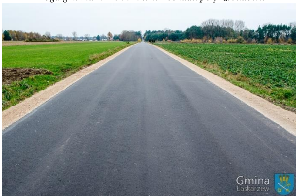
Droga gminna Nr 130605W Dąbrowa – Aleksandrów – Izdebnio w km 1+015 ÷ 1+440