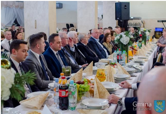
Spotkanie Noworoczne w Melanowie