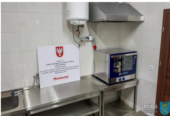
Wyposażenie świetlicy wiejskiej w Woli Rowskiej zakupione ze środków MIAS MAZOWSZE 2020