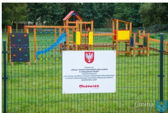
Plac zabaw w Budlu

Ponadto dzięki dotacji w wysokości 20 tys. zł jaką OSP Izdebno otrzymało w 2020 roku ze środków Komendy Głównej PSP na realizację zadania pn. „Zapewnienie gotowości bojowej jednostki ochrony przeciwpożarowej włączonej do krajowego systemu ratowniczo-gaśniczego – Remont strażnicy OSP Izdebno”, udało się wykonać kolejny etap remontu dachu strażnicy. Zadanie to zamknęło się kwotą 39.400,00 zł. Środki w wysokości 19.400,00 zł to dotacja z budżetu gminy Łaskarzew. Prace wykonała również firma KS System. Przed nami jeszcze kolejne etapy remontu dachu strażnicy. Działania w tym kierunku będą podejmowane w latach następnych.