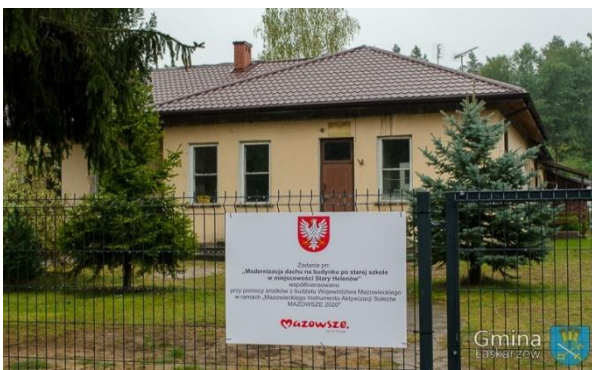
Remont dachu na budynku po starej szkole w Starym Helenowie