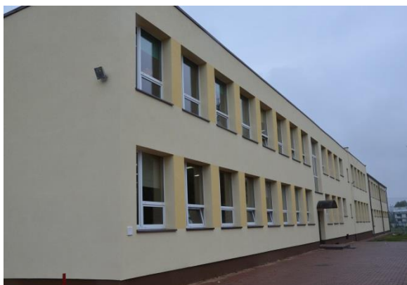
Zespół Szkół w Starym Pilczynie

Placówki oświatowe prowadziły działalność edukacyjną zgodnie z zaplanowanymi programami nauczania.