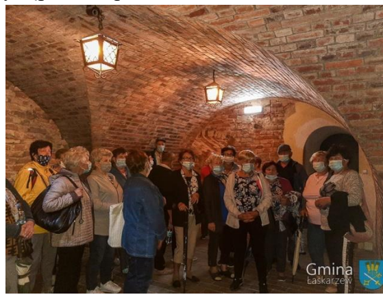
Seniorzy na wycieczce w Sandomierzu

W związku z pandemią Klub Senior+ funkcjonował on-line od 12.03.2020 r. do 31.05.2020 r., a także od 26.10.2020 r. do 31.12.2020 r.