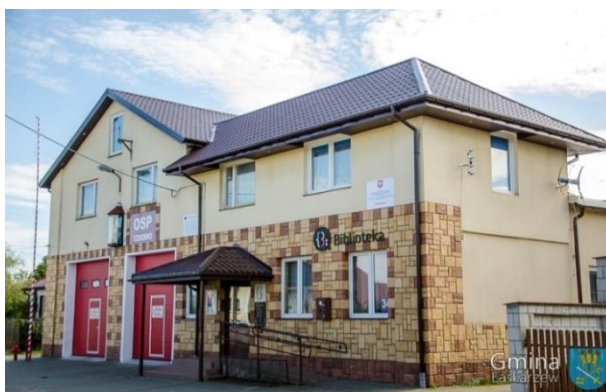
Budynek OSP Izdebno po remoncie dachu