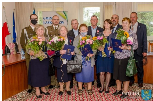
Wręczenie medali dla rodziców żołnierzy