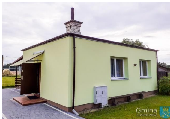
Budynek świetlicy wiejskiej w Lipnikach