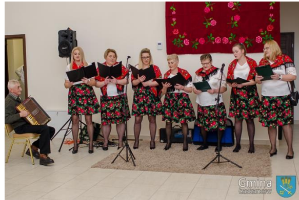
Ostatki na Ludowo w Uścińcu