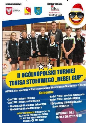
Turniej Rebel Cup