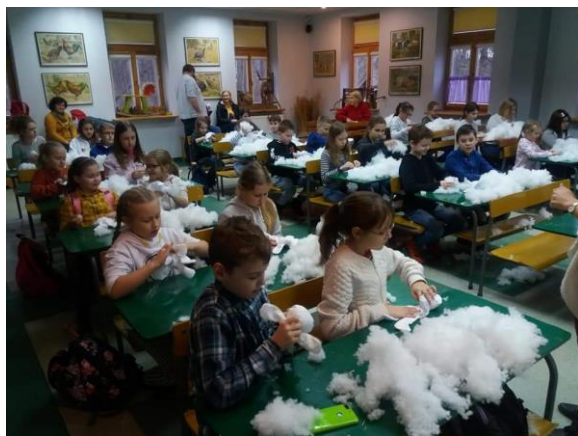
Warsztaty w Muzeum Wsi Radomskiej

elektronicznych e-booków, 2 urządzenia wielofunkcyjne (drukarka, ksero, skaner), 3 zasilacze USB, 3 routery z modemem, czytnik kodów kreskowych, robot edukacyjny do nauki programowania, 10 licencji programu antywirusowego, 6 słuchawek z mikrofonem.