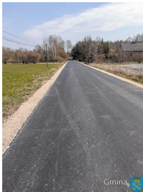
Droga gminna Nr 130602W w Lewikowie po przebudowie